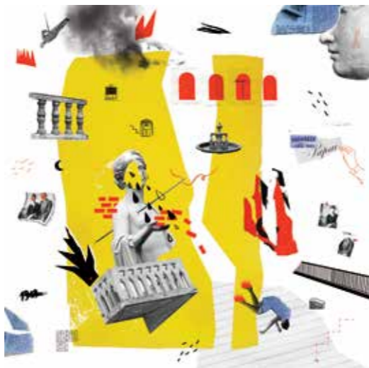
Illusztráció Thury Lili