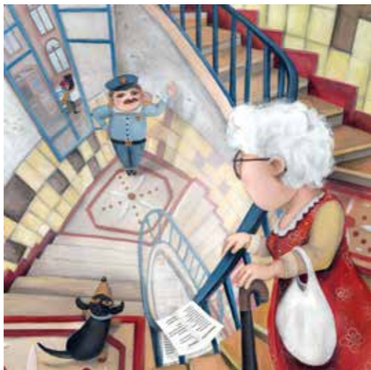
Illusztráció Pernyész Dóra