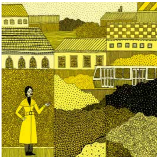
Illusztráció Édes Piroska.