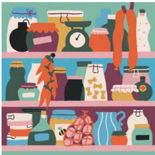
Illusztráció Zengővári Judit