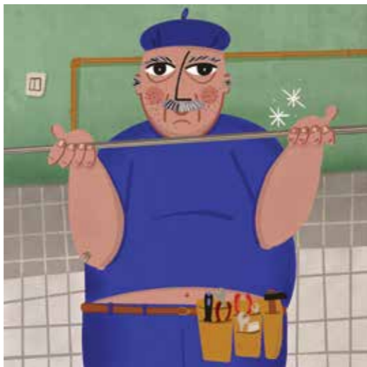
Illusztráció Hitka Viktória