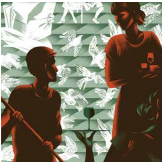
Illusztráció Zsuffa Zsanna